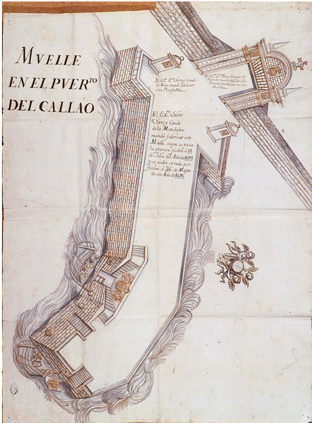
Fig. 4. 1696 Muelle real del Callao.

reconocimiento cuando en 2018 se cumplió el tricentenario de las primeras Ordenanzas que regulan la profesión de Ingeniero en España.